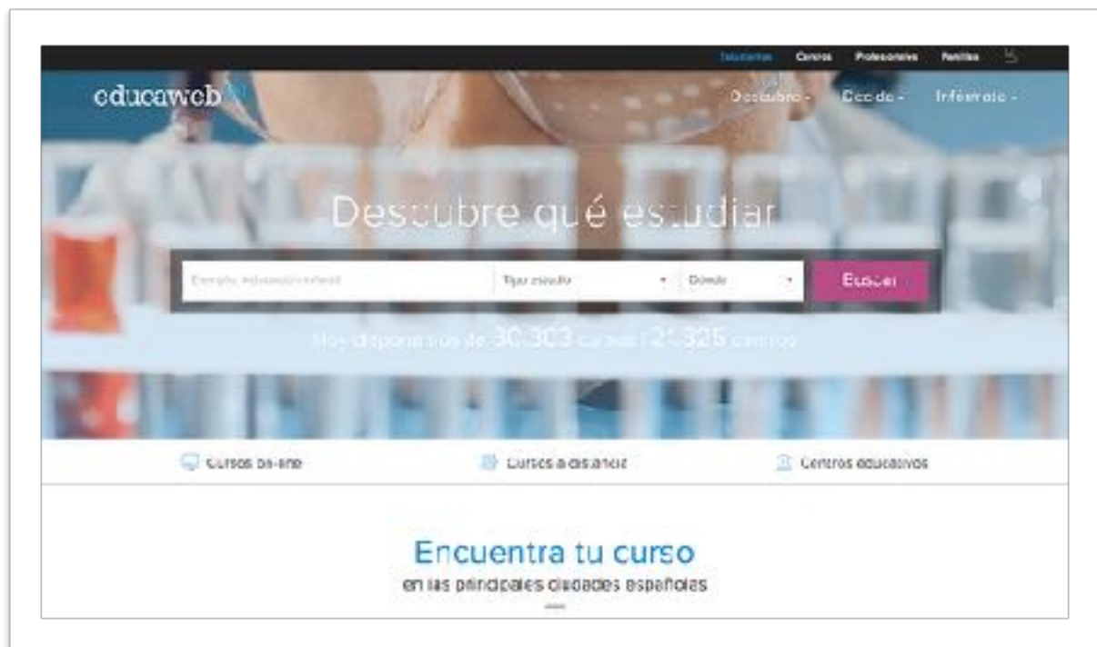
Página de Educaweb